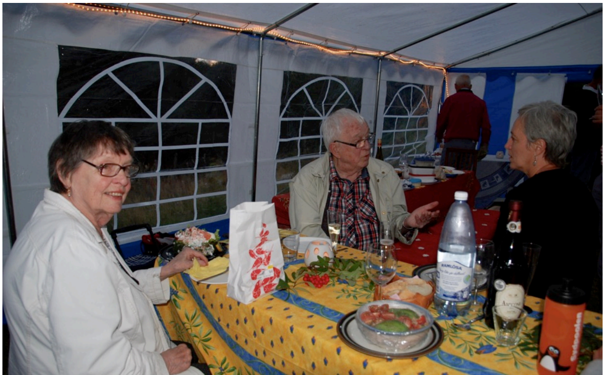
Trevliga samtal innan alla kommit till bords för att äta