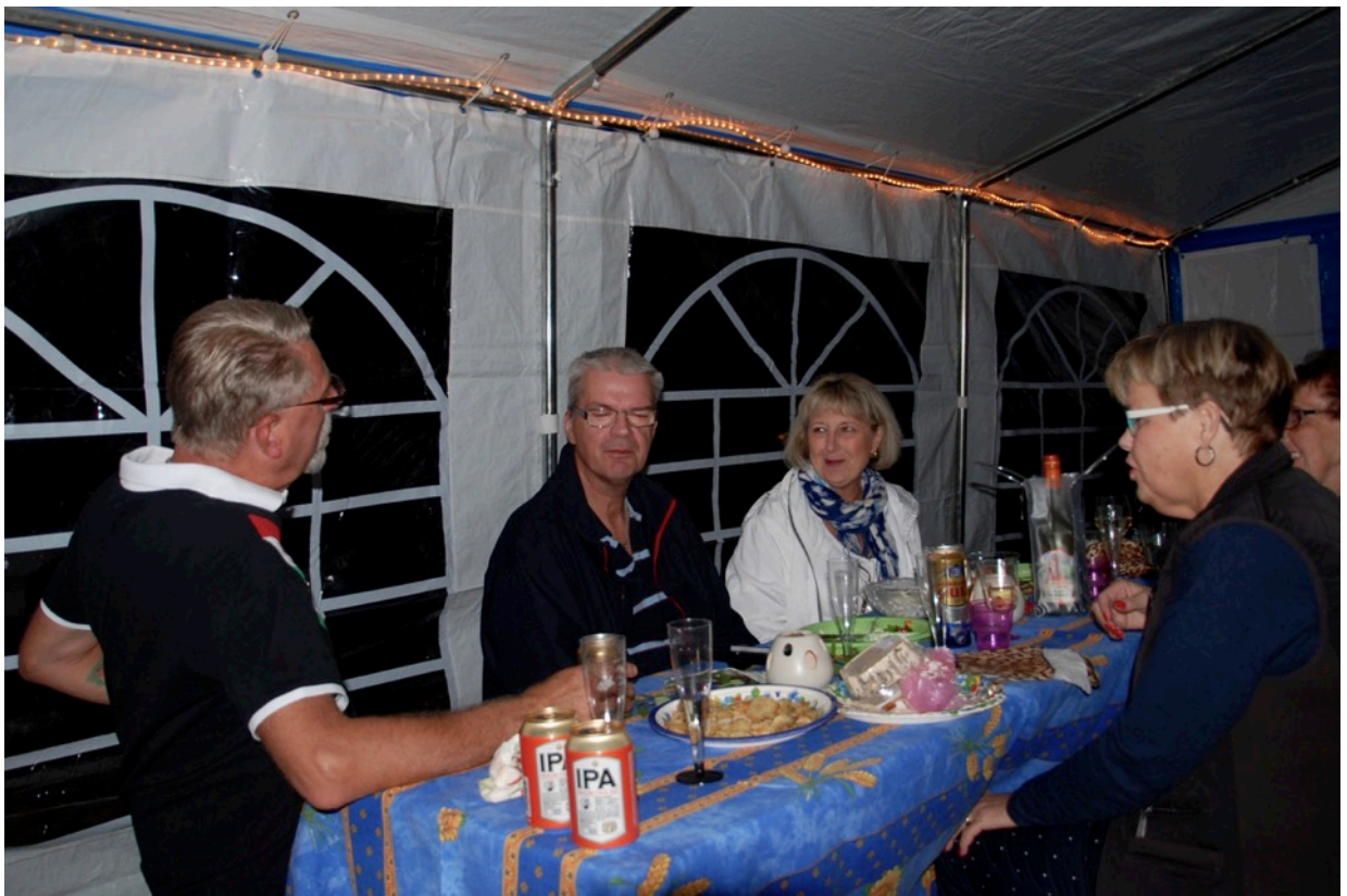
Vid 21.30-tiden var alla mätta och belåtna och det var dags att bryta upp