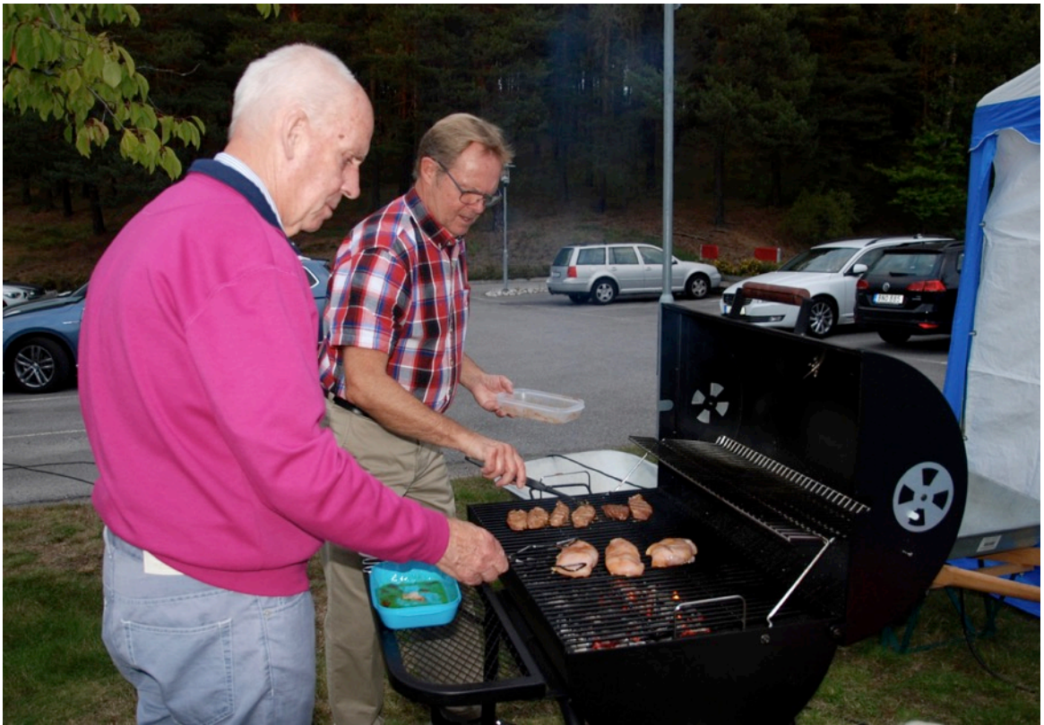
Vid 18-tiden var alla samlade och det var dags för en del att nyttja grillen