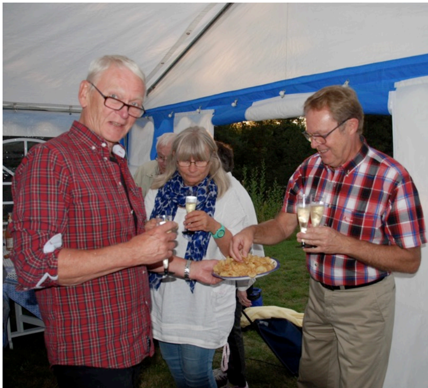
Föreningen bjöd på god bubblig fördrink och chips innan medhavd mat och dryck spisades