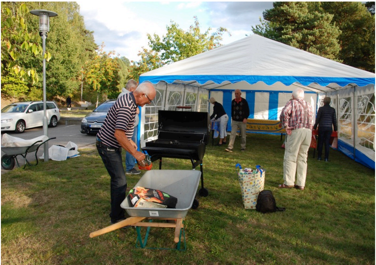
Grillen fixades iordning. Ljusslingor, dukar och värmeljus kom på plats för allas trevnad