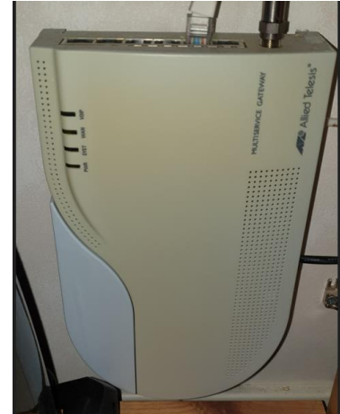
Kundnoden ser ut så här

OBS! Den här informationen gäller endast er som inte tidigare har fått sin kundnod bytt.